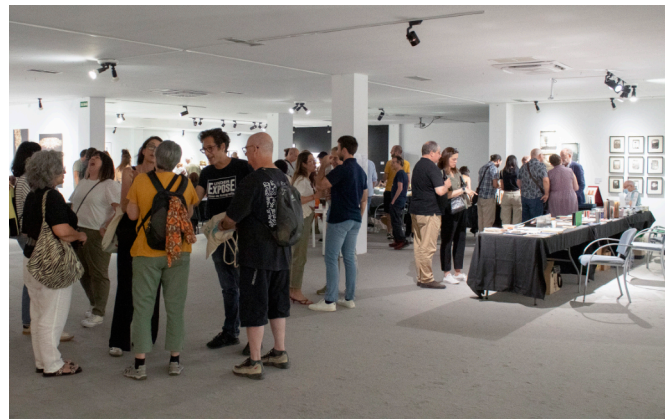
Algunas imágenes de la 4ª edición (2024)

Viernes 16 de mayo de 17.00 a 21.00 horas