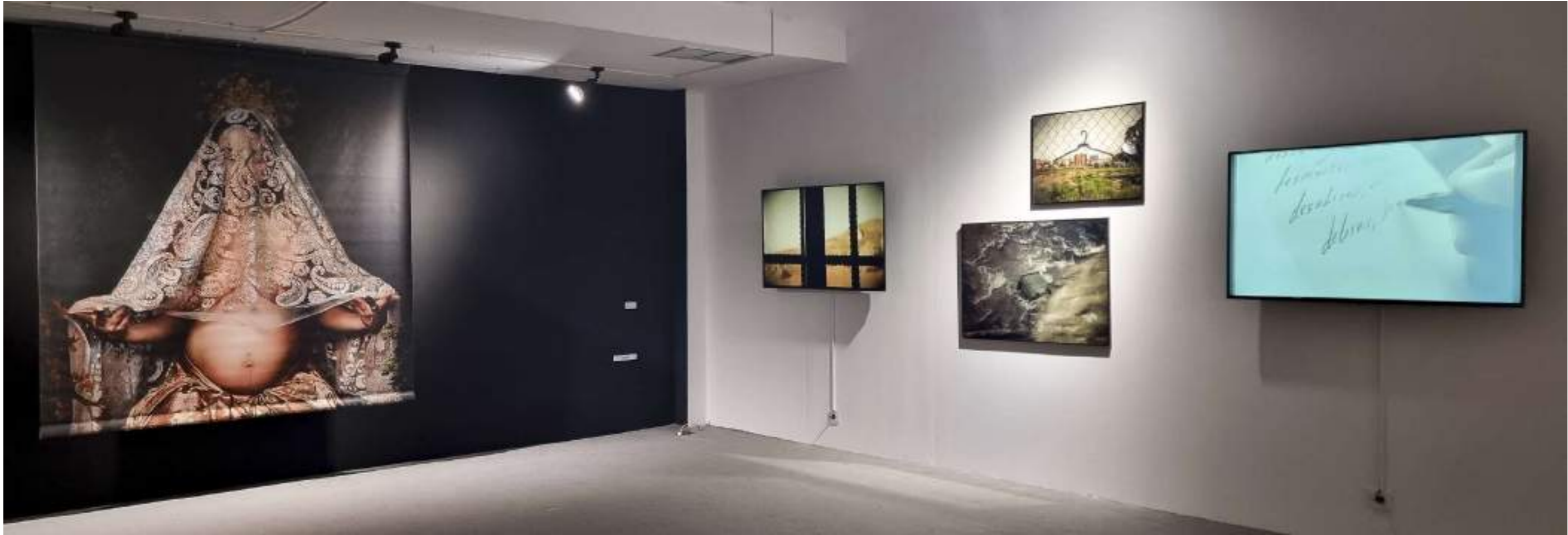
Vista sexta sala con obras de Lola López Cozar y Ulalalau