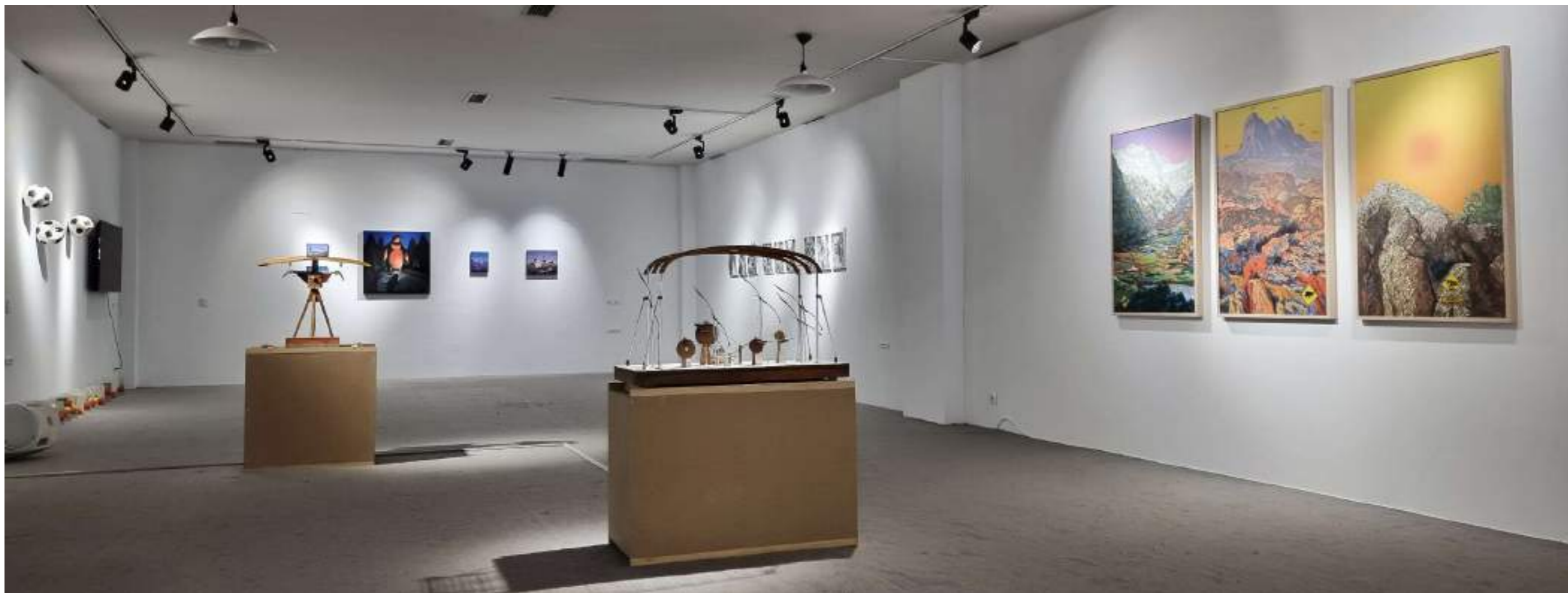
Vista segunda sala con obras de Isabel Oliver, Arturo Doñate, Francisco Carmena y Miguel Ángel Moreno Carretero