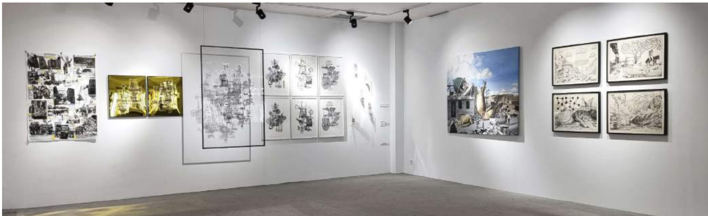
Vista primera sala con obras de Juan Cabello y Óscar Seco