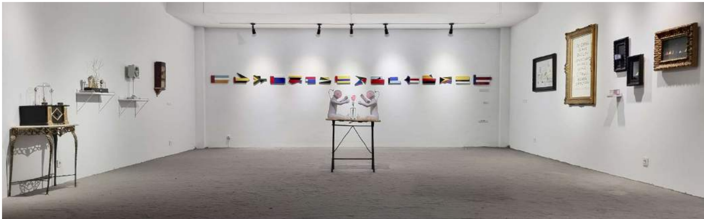
Vista quinta sala con obras de Cyro García, David Disoluto y José Casany