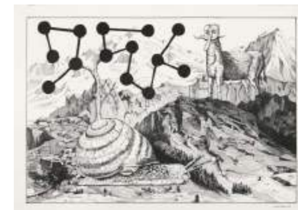
EST_ART Artista: Óscar Seco Título: Seres imaginarios Técnica: Tinta sobre papel fabriano Medidas obra: 50 x 70 cm. Edición: Piezas únicas (2017) Precio: 1.575 € + IVA (cada pieza)